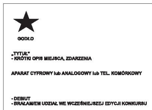
przykład opisu fotografii

! W przypadku fotografii z telefonu komórkowego w kopercie z wglądówkami winna znajdować się płyta CD z nagraniem zdjęciami biorącymi udział w konkursie, zdjęciem autora i krótkim opisem biograficznym.