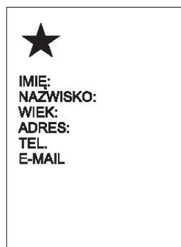
kartka z danymi