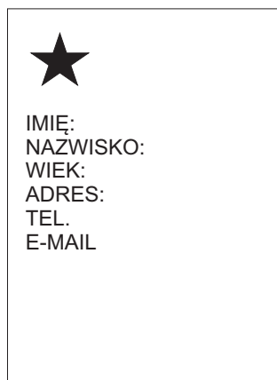
kartka z danymi