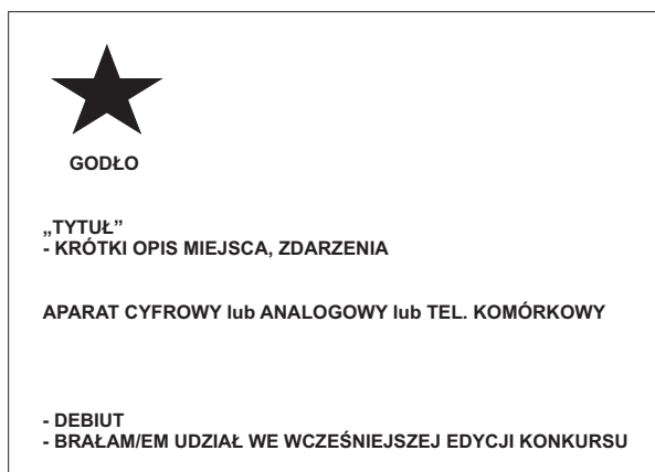
przykład opisu fotografii