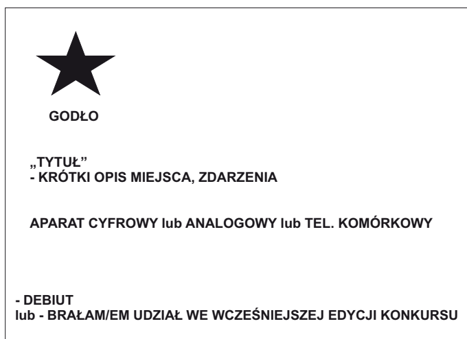
przykład opisu fotografii

! Do zgłoszenia, podpisanej zgody itp. załączników, w kopercie z godłem i nazwiskiem, powinna znajdować się płyta CD z nagraniem zdjęciami biorącymi udział w konkursie i krótkim opisem biograficznym.